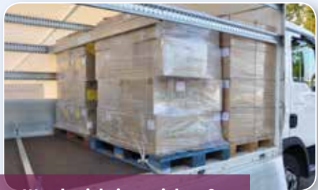
Wurde richtig gesichert?