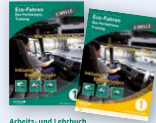
Arbeits- und Lehrbuch inkl. praktischem Pocket-Guide Bestell-Nr. 24836

Modul 1+2 sind ab Ende November, 4 + 5 in 2015, Modul 3 bereits erhältlich!