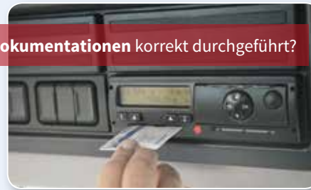
Dokumentationen korrekt durchgeführt?