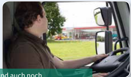
... und auch noch wirtschaftlich fahren?