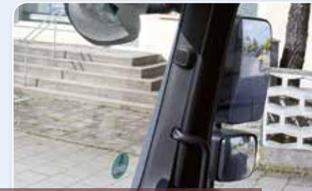
Gefahren bzw. Risiken erkennen und vorbeugen.