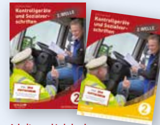
Arbeits- und Lehrbuch inkl. praktischem Pocket-Guide Bestell-Nr. 24841