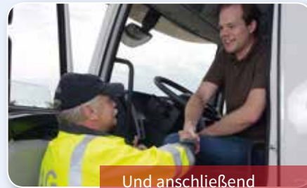
Und anschließend entspannt weiterfahren?