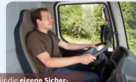
Für die eigene Sicherheit und die anderer.