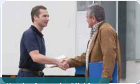
Die Kunden immer im Blick?