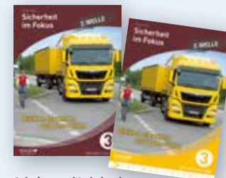
Arbeits- und Lehrbuch inkl. praktischem Pocket-Guide Bestell-Nr. 24846