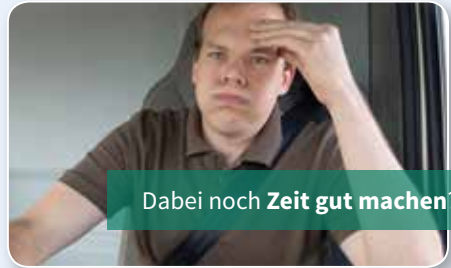
Dabei noch Zeit gut machen?