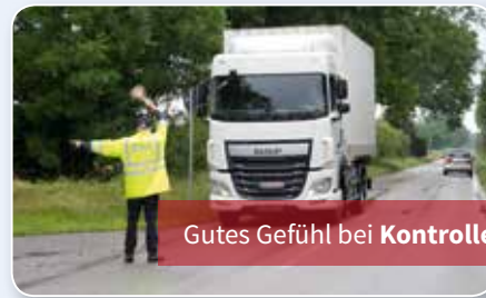
Gutes Gefühl bei Kontrollen?